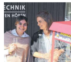
Sekt und Popcorn beim Hörzentrum.