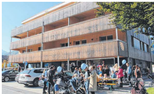
Kinderschinken und Luftballons für die kleinen Besucher bei der VUX-Versicherungsagentur im Komot.